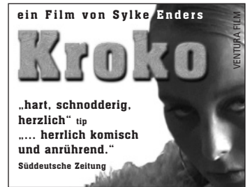
Stopper (45x35 mm)