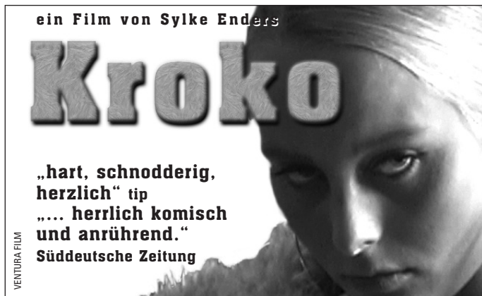
1/8 Seite (90x55 mm)