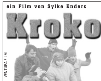
Stopper (45x35 mm)