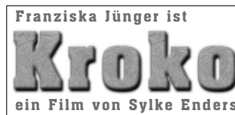
1-Spalter (45x21 mm)