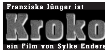
1-Spalter (45x21 mm)