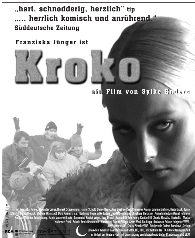
1/4 Seite (90x110 mm)