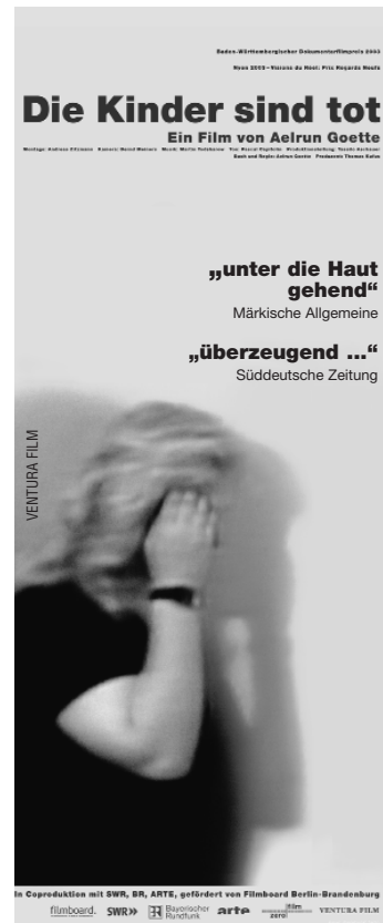
1-Spalter (45x110 mm)