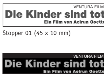
Stopper 01 (45 x 10 mm)