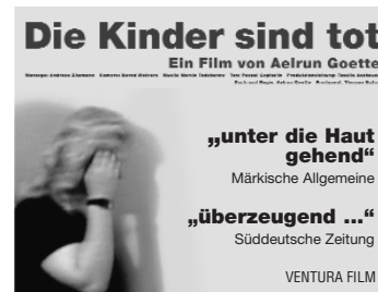
Stopper (45x35 mm)